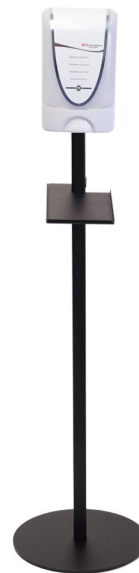
Dispenser Deb Touch Free TF2 Art.nr. 52304